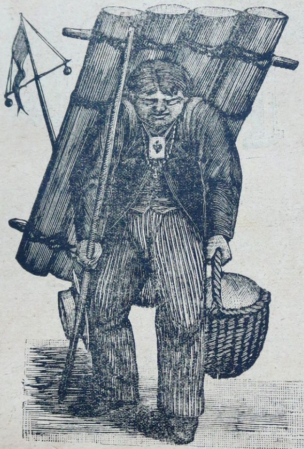
UN VIAJERO PRUDENTE.